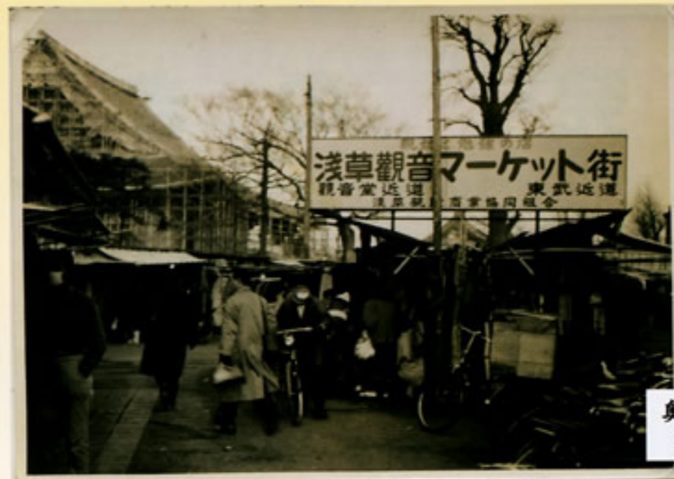
奥山は浅草観音マーケット街

江戸時代から奥山と呼ばれていたのは本堂の西側と北側一帯でした。水茶屋・団子屋・楊枝屋・楊弓場などに混じって、小屋がけの種々の見世物や大道芸が営業していました。明治以降は、芝居小屋などの興業は総て六区に集められてしまいましたが、現在でも奥山の地名は往時を偲ぶ名称として浅草の人々に親しまれています。写真は、昭和25年頃の奥山。所狭しとバラックのお店が並んでいます。戦災に耐えた大銀本は、五重塔北側で現在も健在です。